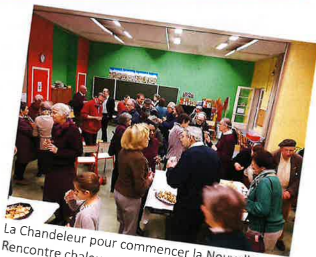
La Chandeleur pour commencer la Nouvelle Année 2020 Rencontre chaleureuse, toutes générations confondues !