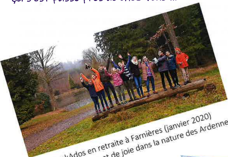
MeekAdos en retraite à Farnières (janvier 2020) Weekend de prière et de joie dans la nature des Ardennes